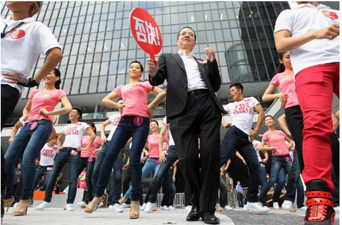
《亚洲电视》在香港政府总部门外，反对香港政府发免费电视牌照。

形容有关指控「空洞」，他说：「这是最不负责任的指控因为无证据。我们就有证据显示中联办如何干预选举。」