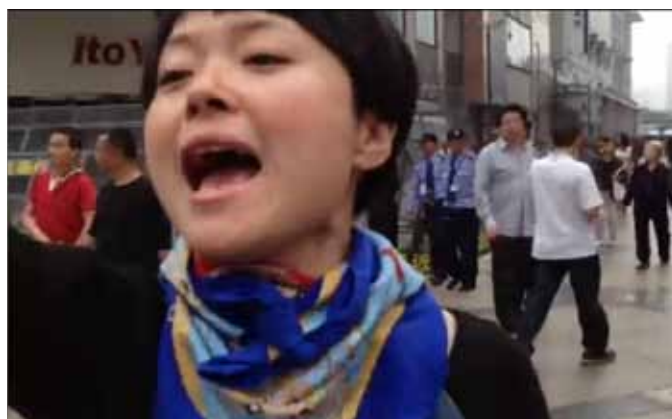
香港记者在谷开来案件外拍摄时，被一名身份不明的女士突然阻挠被诬告盗窃。一名公安立即前来阻止记者采访，但该名女士便突然失踪。— 香港记者

中国官方目睹部份案件吸引国际媒体关注，于是作出步置以显示中国对世界的开放。不过，