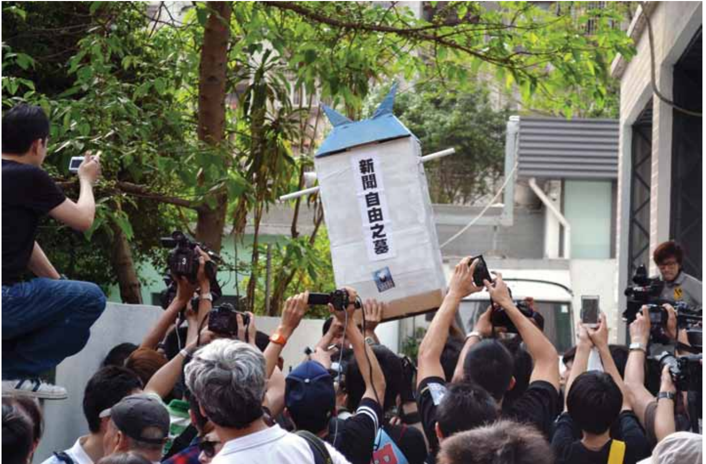
数百名澳门记者在澳门抗议澳门媒体自我审查日渐恶化。

力改革，让澳门能趋向民主。澳门媒体工作者协会四月廿六日发出公开信，鼓励记者在五月一日穿上黑色T恤哀悼澳门的新闻自由日渐恶化的情况。