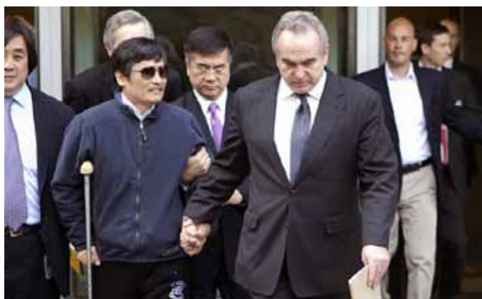
失明维权人士陈光诚逃离软禁后，成功逃往驻北京的美领馆。

难包括被袭击、恐吓及整个家庭被软禁。不过，他的事情却没有一所中国境内的媒体作出报道。