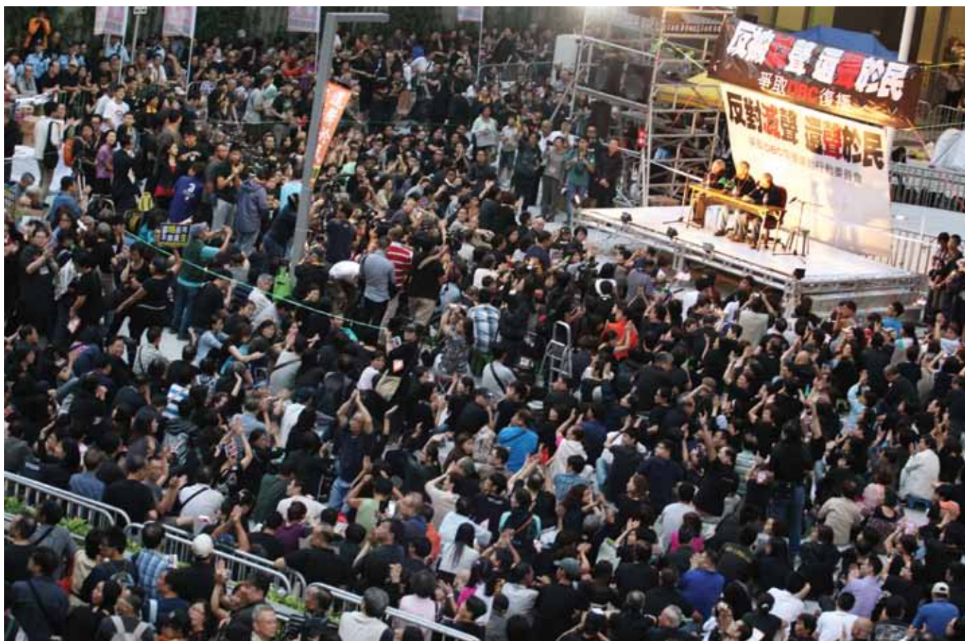
数码广播称受到政治干预，员工及公众遂在香港政府总部外抗议。