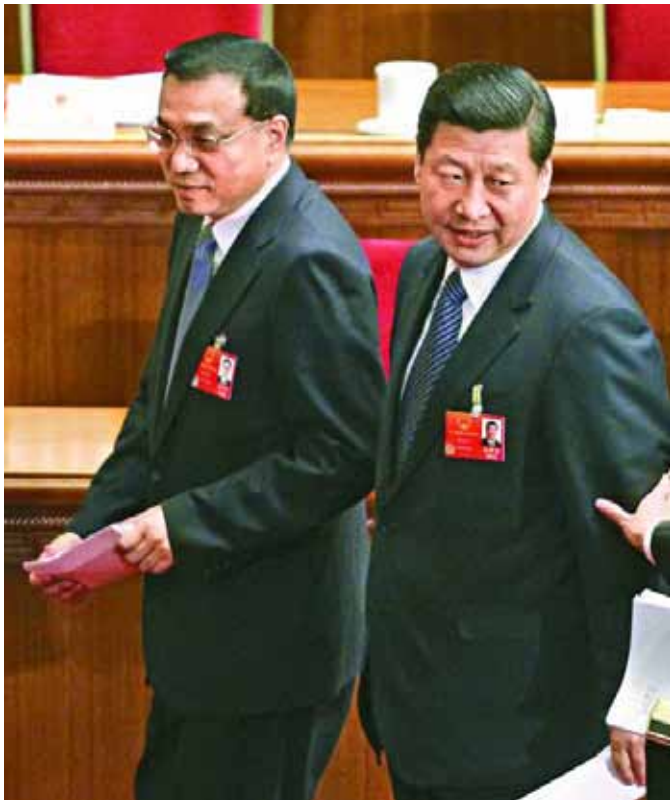
正当中共十八大召开前夕，网络审查再度加紧。中共总书记及政治局常委李克强。

根据《中国数字时代》报道，所有媒体都不能报道「上访」或「突发事件」，此外，媒体更不准报道或评论香港的特首选举，除非有关报道事先获得港澳办批准及审查。