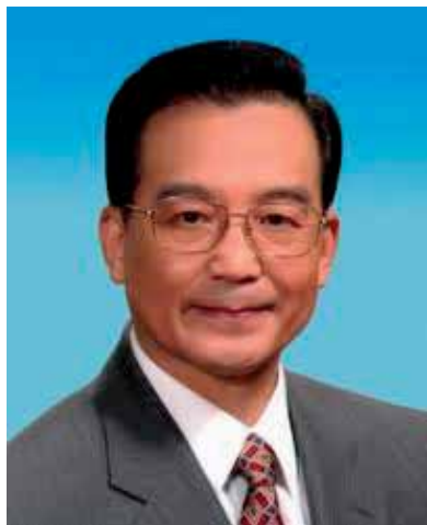
国际媒体披露中国总理温家宝家属家财万贯后，该媒体的官方网站立即在中国被屏蔽。

互联网已成为增长最快及最具影响力，可把讯息、意念及沟通在国际间传播的工具。二〇一一年，中国公布互联网自一九九四年发展以来，已有达五亿一千三百多万的网民。当中东的茉莉花革命传到中国，衍生二〇一一年的抗议示威暴发，中央政府便在国务院中成立一个专责监控互联网的办公室。