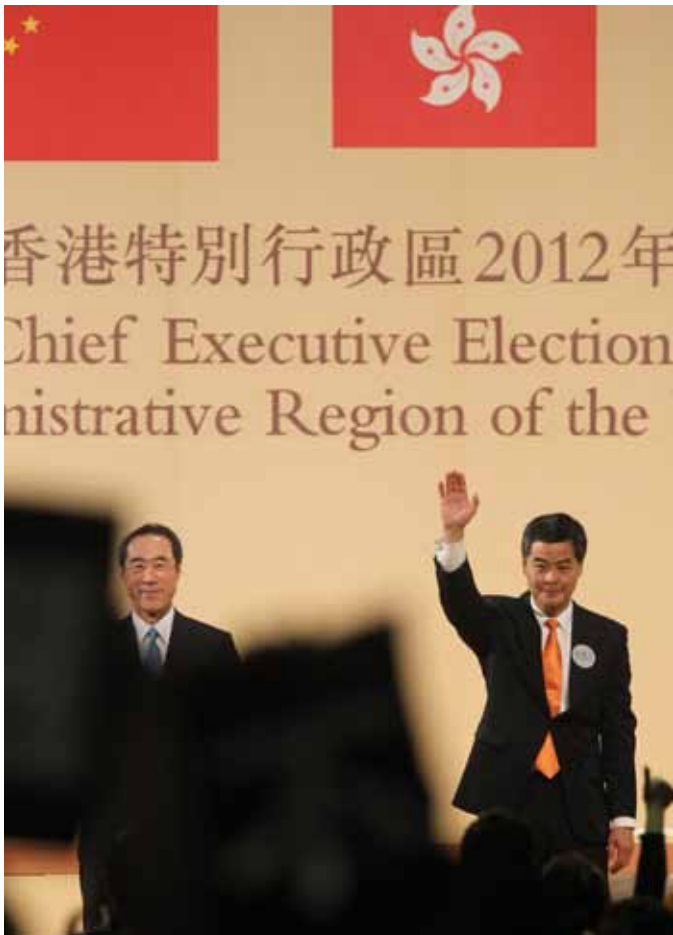
三月廿五日，一千二百名的特首选举委员会进行投票，梁振英以六百九十八票获选，出任新一任的香港特别行政区行政首长。

二〇一二年是香港新闻界艰难的一年，记者因履行采访职务而面对被刑事起诉，被惩处的危机。不过，香港政府偏离长久良好管治的做法最令人关注。香港特区政府行政首长梁振英回避直接解释私人大宅违规僭建的问题；教育局局长及警务处处长往北京述职前，未履行职责向公众交待。此外，港澳办副主任张晓明曾说《基本法》廿三条需要立法，此法普遍地相信既践踏新闻自由又影响结社自由。二〇〇三年，香港前特首董建华曾欲订立此法，但最终因超过五十万名香港市民上街抗议而最终撤回。