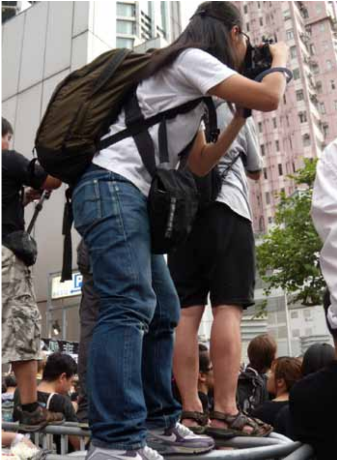
由于香港警方大幅收窄媒体在中联办外采访的空间，引致不少记者需要危险工作。