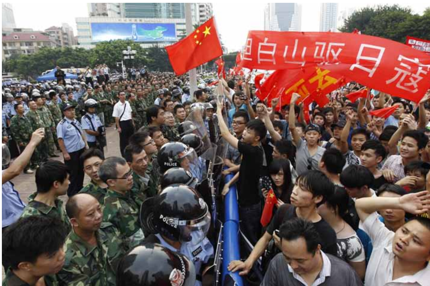
钓鱼岛（又称尖阁诸岛）主权争议引发中国大陆连串示威发生。

未能就解决南中国海纠纷达成一致协议。这是外交部长会议首次未能达成一致意见的事情。大陆媒体未能引用其它消息来源报道有关事件，只能引用官方媒体《新华社》的报道。