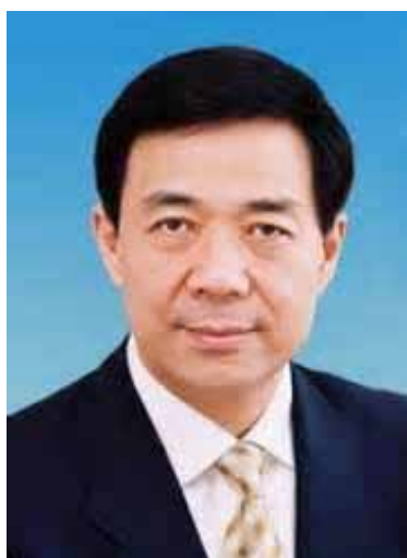
重庆市前党委书记薄熙来丑闻事件发生后，导致中国新闻界处于「冰封期」原因之一。

二〇一二年的中国媒体状况，可以形容为延续二〇一一年的「冰封期」。公众难以看到中国媒体里有深度调查的报道。同时间，媒体更出现每天接获十多项限制报道的禁令，引致媒体根本难以履行社会监察的角色。「冰封期」里，曾出现多项戏剧性的事件当中包括被形容为中国「太子党」的薄熙来被踢出局的事件、重庆前副市长兼市公安局局长的王立军，二月时逃跑到位于成都的美国领事馆求助、经年被软禁的失明维权「律师」陈光诚四月份成功逃离软禁，成功逃往北京的美国领事馆、广东省乌坎村二月份的首次民主选举、九月份中日两国争议多年的钓鱼岛（日本称尖阁诸岛）主权问题、十一月份中共十八大会议选出新一批的中央政治局常委。