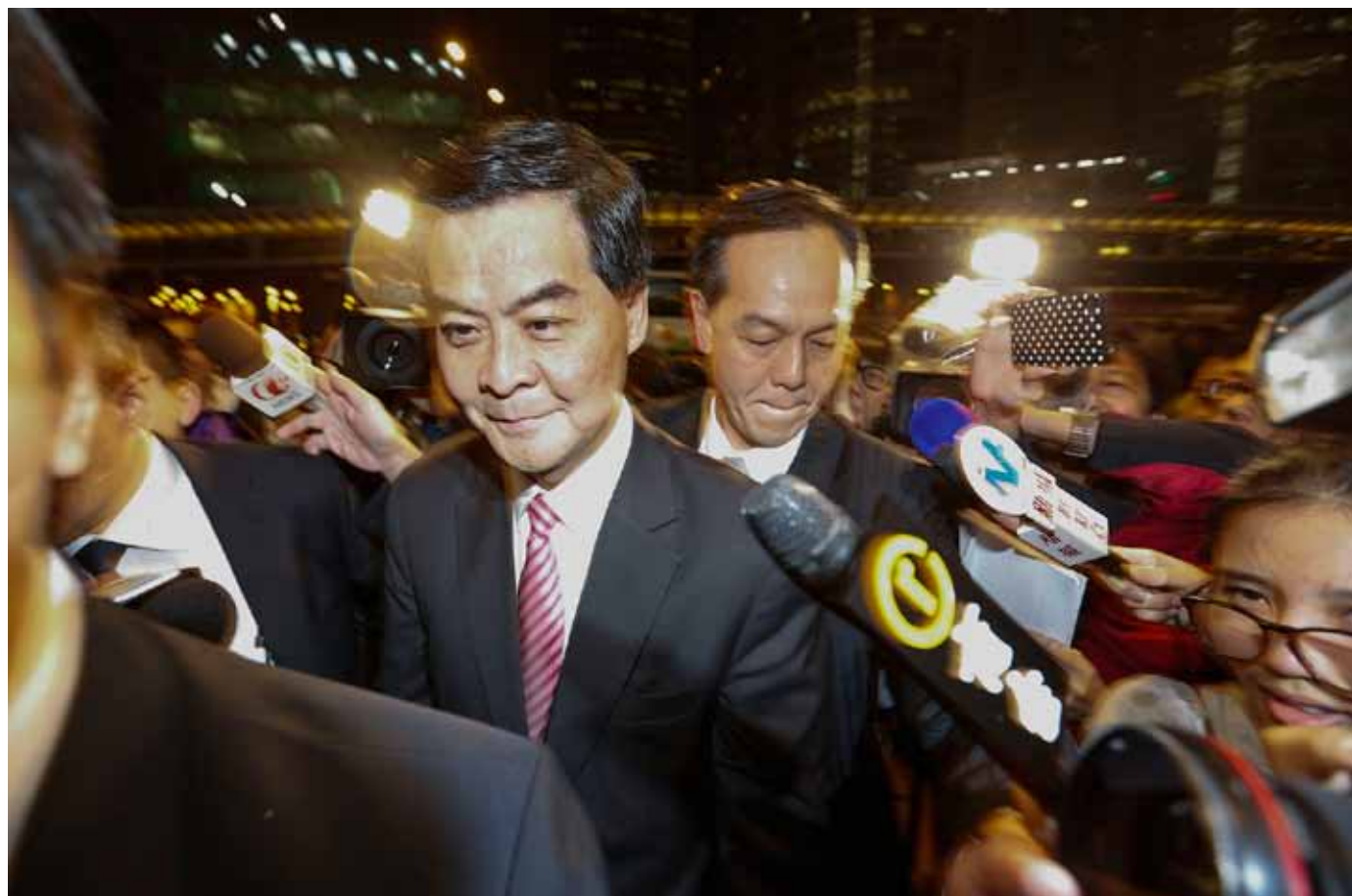
香港特别行政区新任特首梁振英每面对争议事件时，都会以回避态度对待媒体。

当媒体不断向梁振英及屋宇署要求解释时，梁未有安排记者会逐一响应记者的提问，相反，他选择在一些公开活动场合时，简短响应记者。十一月廿七日，屋宇署只透过书面交待僭建墙的事。声明中指，屋宇署在调查过程中有发现该「僭建墙」，且已四度去信梁振英要求深入调查。可是，屋宇署