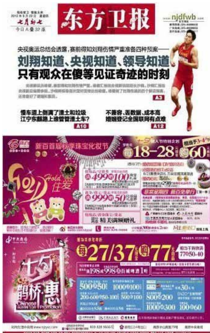
中国栏王刘翔八月七日参加奥运比赛时跌倒一事，中宣部下令禁媒体有负面报道。- 网上图片

在暴雨发生前两天，是二〇一一年七月廿三日温州动车事故发生一周年纪念日，该次事件导致四十人死，至少一百九十二人受伤。媒体为此纪念日