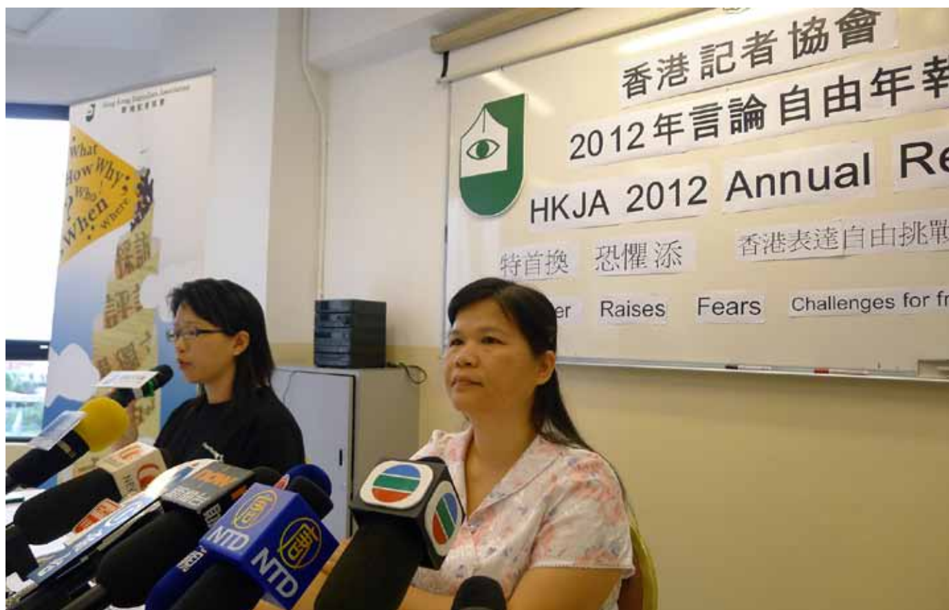
香港记者协会在业界进行民调后，发现回复问卷的记者有近六成人士相信梁振英主政后，新闻自由会受压。