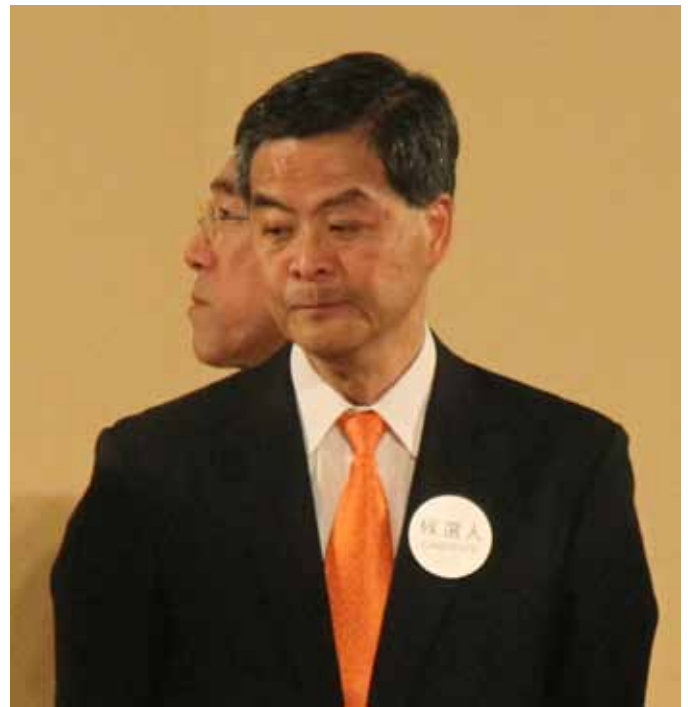
在香港特首选举及立法会选举中，媒体遇到沉重的政治干预。

香港争取新闻新由的倡议者在特首选举时及期后的警惕心特别强。自二〇一二年始，三名参与特首选举，其中两名候选人即前政务司司长唐英年，