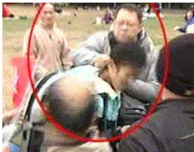
Now电视台摄录师因采访支持政府游行，被一名支持政府的示威者拳打头部。—《明报》提供

香港记者协会四月时在业界进行调查，发现有不少记者感觉新闻自由在倒退中。根据调查显示，在六百六十三名被访者中觉得，比对曾荫权二